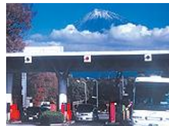
■車(東名富士I.C.)をご利用の方