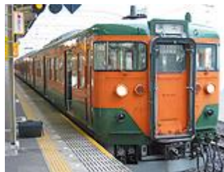
■東海道本線(富士駅)をご利用の方