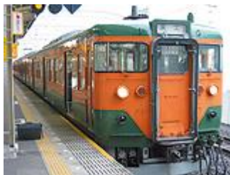
■東海道本線(富士駅)をご利用の方