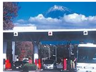
■車(東名富士 I.C.)をご利用の方