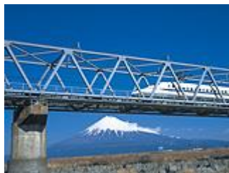
■新幹線(新富士駅)をご利用の方